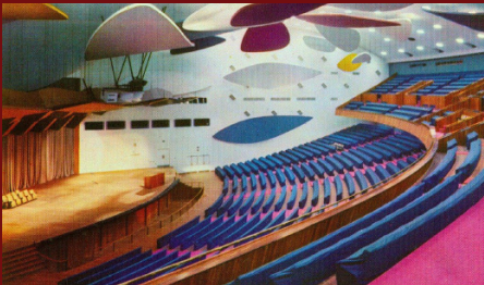
Ciudad Universitaria de Caracas, 2000