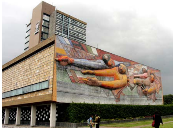
Rectorado y mural "El pueblo a la Universidad"