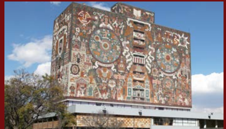
Universidad Nacional Autónoma de México (UNAM), 2007

Alcalá de Henares, 9 y 10 de mayo de 2013