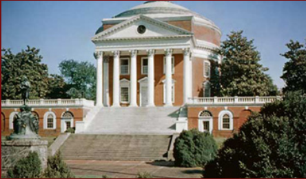
Universidad de Virginia, 1987