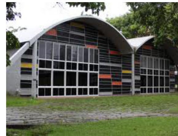
Facultad de Ingeniería