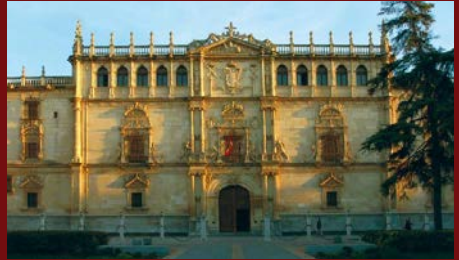
Universidad de Alcalá, 1998