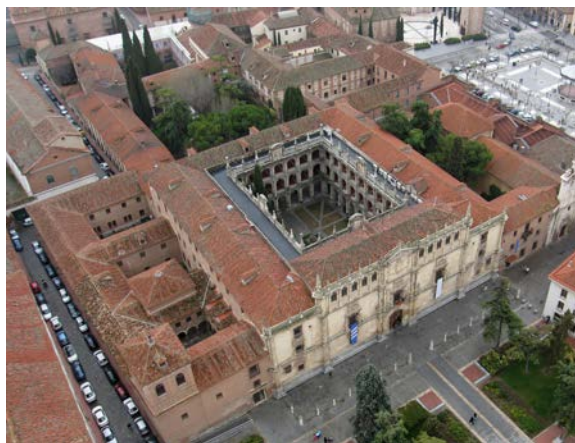
Vista aérea de la manzana fundacional cisneriana.