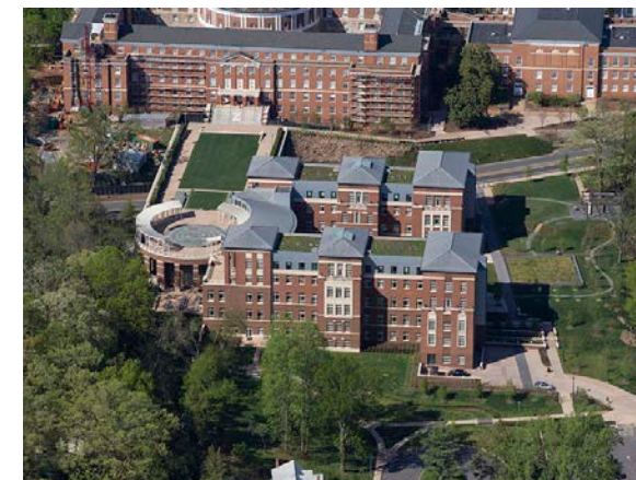
Vista aérea del complejo de South Lawn